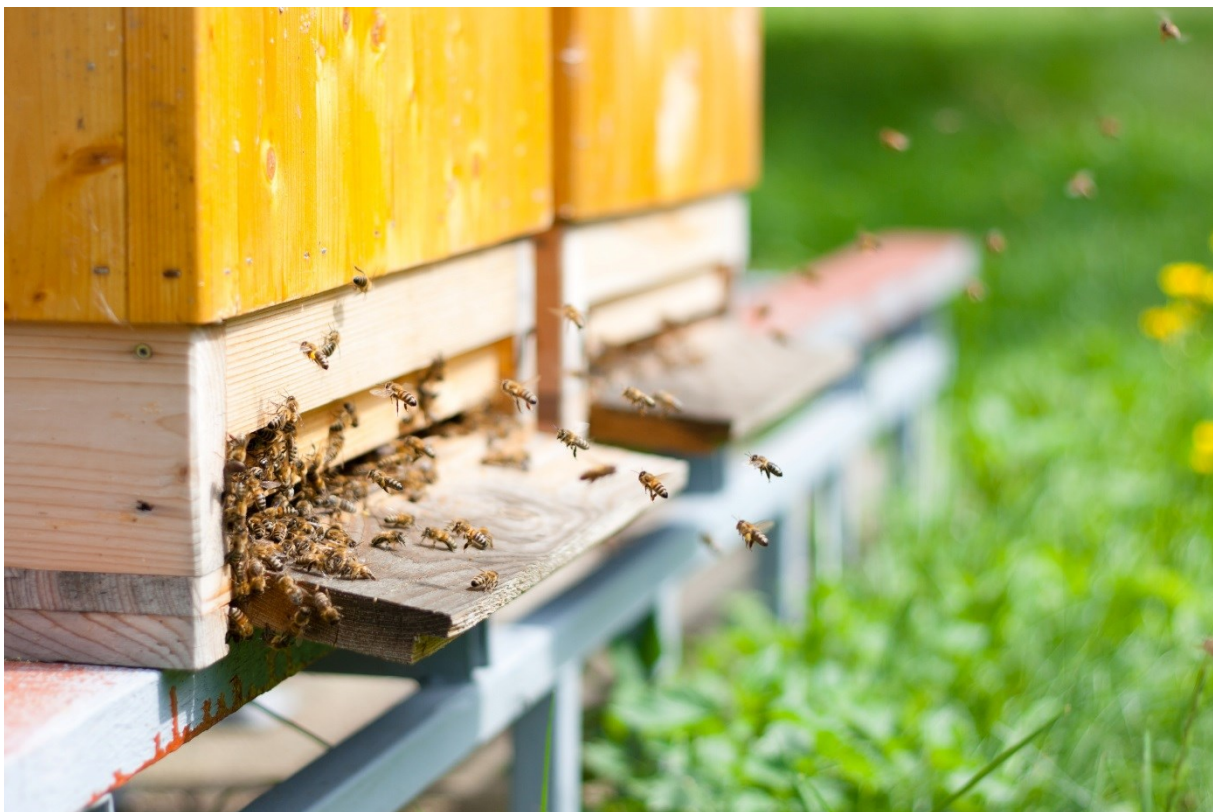
Abbildung II: Bis Honigbienen im Frühjahr wieder ausfliegen, können neun Monate Winterfütterung nötig sein. ii

Empfehlungen, die sich aus den genannten Anforderungen an Futtermittel für Honigbienen hinsichtlich der Herstellung, des Transports, des Handels und für den Imker ergeben, werden unter Punkt 4 aufgeführt.